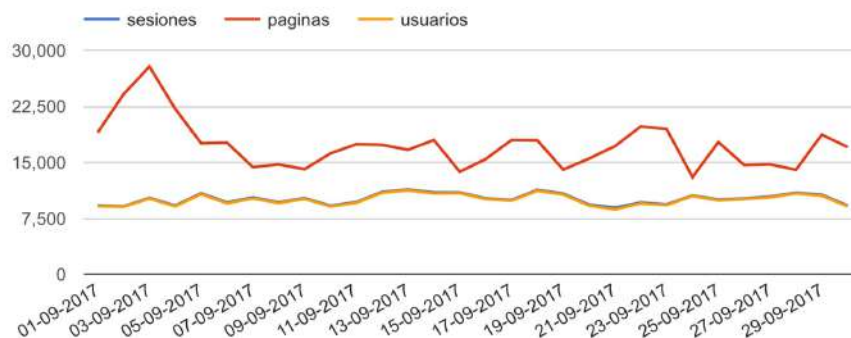
GRÁFICO DE VISITAS DE GOOGLE ANALYTICS

Cibeles Group certifica que los datos abajo indicados han sido auditados por el equipo técnico de ingeniería de Digital Orion, S.A. de las analíticas generadas por Google Analytics.