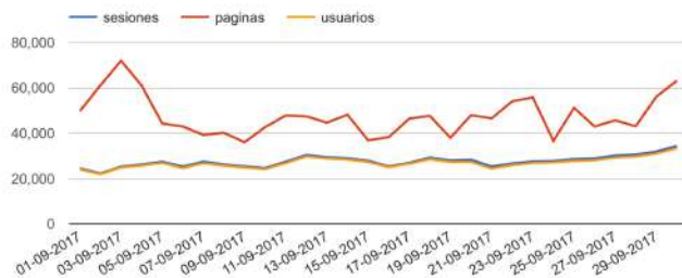
GRÁFICO DE VISITAS DE GOOGLE ANALYTICS

Cibeles Group certifica que los datos abajo indicados han sido auditados por el equipo técnico de ingeniería de Digital Orion, S.A. de las analíticas generadas por Google Analytics.