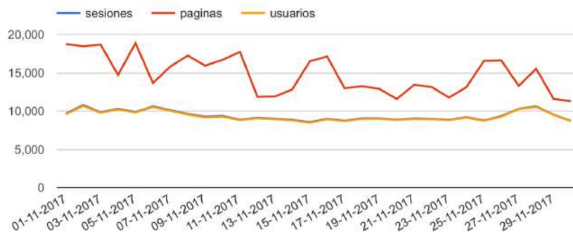
GRÁFICO DE VISITAS DE GOOGLE ANALYTICS

Cibeles Group certifica que los datos abajo indicados han sido auditados por el equipo técnico de ingeniería de Digital Orion, S.A. de las analíticas generadas por Google Analytics.