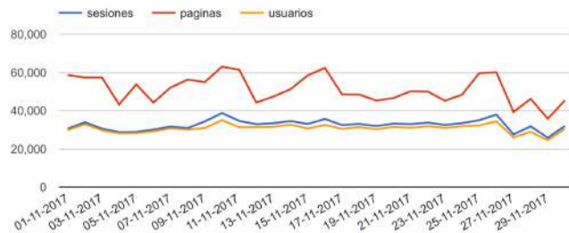
GRÁFICO DE VISITAS DE GOOGLE ANALYTICS

Cibele Group certifica que los datos abajo indicados han sido auditados por el equipo técnico de ingeniería de Digital Orion, S.A. de las analíticas generadas por Google Analytics.