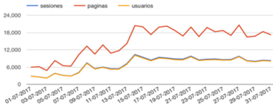
GRÁFICO DE VISITAS DE GOOGLE ANALYTICS

Cibeles Group certifica que los datos abajo indicados han sido auditados por el equipo técnico de ingeniería de Digital Orion, S.A. de las analíticas generadas por Google Analytics.